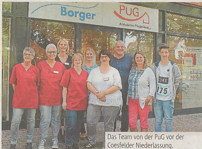
Das Team von der PuG vor der Coesfelder Niederlassung.

Wenn aus Ehepartnern, Kindern oder Enkelkindern plötzlich pflegende Angehörige werden, dann muss guter Rat her. Und genau diesen finden die Kunden beim Pflegedienst PuG an der Letter Straße in Coesfeld. Kompetente und freundliche Beratung, ein offenes Ohr und kurze Wege zum benachbarten Sanitätshaus, dafür steht das achtköpfige Team.