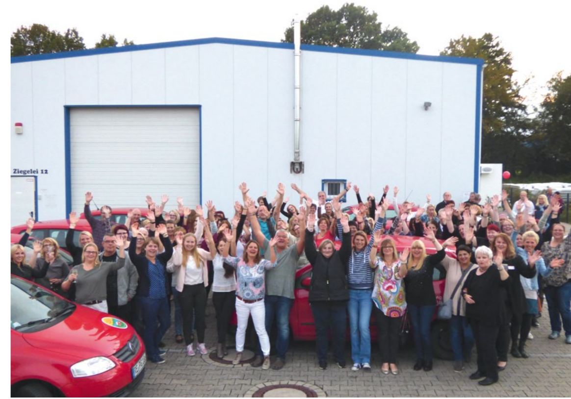
Umzug in die neuen Büroräume an der Ziegelei: Das PuG-Team traf sich dort zur Geburtstagsfeier.

Die Beratung rund um die Pflege gehört zu den Kernaufgaben und wird kostenlos angeboten. Das Büro an der Lavesumer Straße 3a hat an den Markttagen in Haltern am See geöffnet, sonst nimmt das Team gerne telefonische Anfragen entgegen.